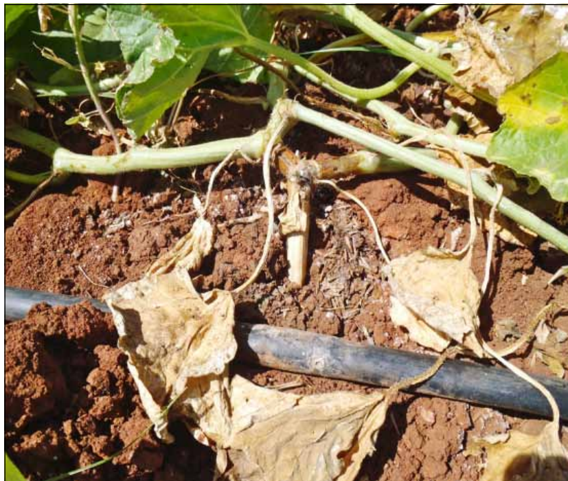
Figura 2. Síntomas de gomosis causado por Didimella sp.