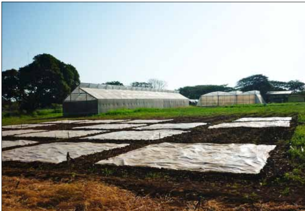
Figura 1. Tratamientos de biofumigación aplicados en campo.

Los semilleros se hicieron en bandejas dentro de una casa de vegetación y se realizó el trasplante después de 13 días. El manejo de insectos y fertilización se realizó según la tecnología generada por el IDIAP para el cultivo de cucurbitáceas (González et al. 2010). Se utilizó riego por goteo y fertirriego de acuerdo a las necesidades del cultivo por etapa fenológica. No se presentaron enfermedades foliares.