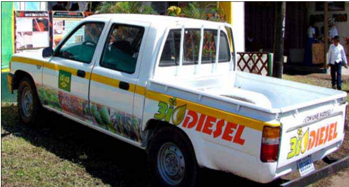
Figura 2. Vehículo que ha recorrido más de 5000 km utilizando biodiesel B100.

acumulado un recorrido mayor a 5000 km usando B100. Durante ese recorrido no se han observado fallas en el motor (Figura 2).