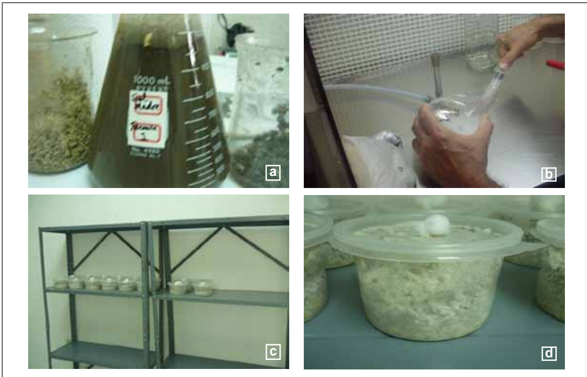
Figura 2. Pasos en la producción de hongos sobre sustrato de arroz: Dilución del medio que contiene el hongo esporulado (a); inoculación del sustrato (b); incubación del sustrato inoculado (c); sustrato después de los 20 días de incubación (d).

El sustrato de arroz se esterilizó en autoclave por 15 min, a 121°C y 101325 Pa de presión. Transcurrido este proceso, se inoculó con 20 cc por envase de la suspensión del hongo previamente preparado, girando el envase para distribuir lo más uniforme la suspensión sobre el arroz. El sustrato inoculado fue colocado en un cuarto de incubación por 20 días (Figura 2).