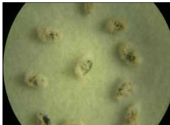
Figura 1. Adultos de broca del café, con el hongo Isaria spp. esporulada en medio PDA. Boquete, 2012.

de biocontroladores del IDIAP, ubicado en Río Sereno, Renacimiento, provincia de Chiriquí y cepas comerciales de B. bassiana y M. anisopliae provenientes de un laboratorio ubicado en el distrito de Boquete. Los aislamientos de las cepas comerciales de B. bassiana y M. anisopliae y el aislamiento de la cepa nativa de Isaria spp. se reactivaron sobre adultos de broca del café y se colocaron en medio Papa Dextrosa Agar (PDA) (Vélez et al. 1997). Se deben hacer pases sobre el insecto cada veinte días para mantener la patogenicidad del hongo (González et al. 1993). El medio con los adultos inoculados y con los aislamientos, se incubaron a temperatura ambiente. Finalmente, cuando el hongo alcanzó su máximo crecimiento y esporulación en el medio, se inició la producción masiva, a partir de este aislamiento (Figura 1).